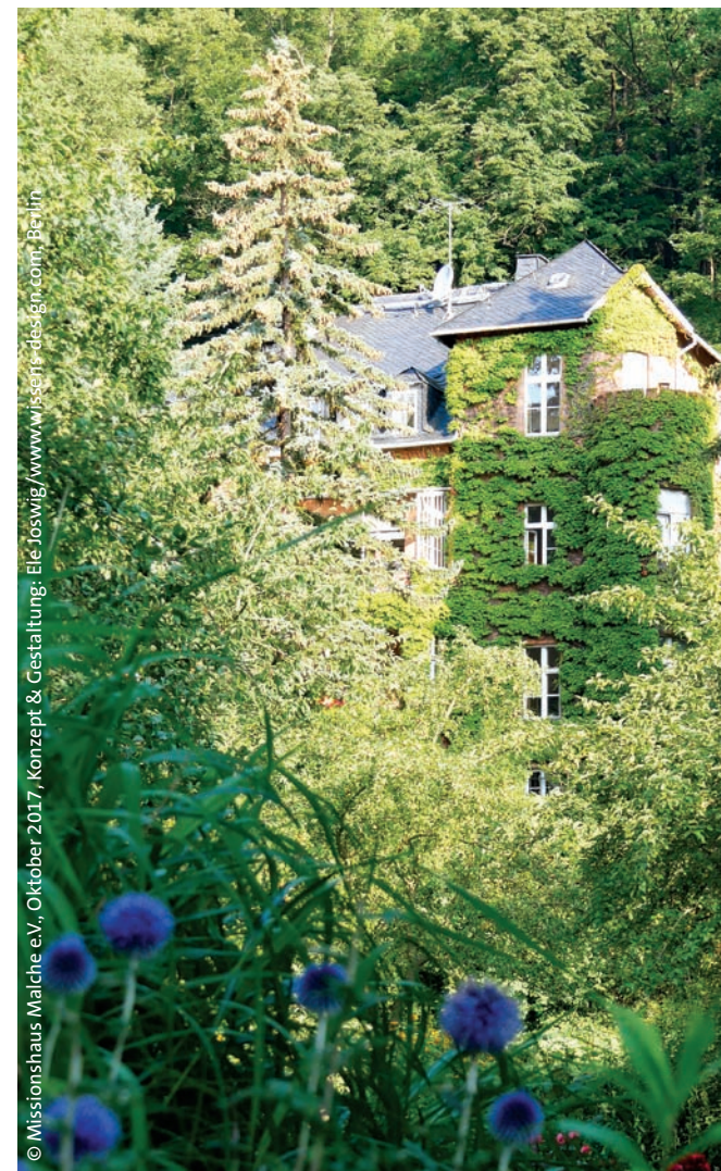
© Missionshaus Malche e.V., Oktober 2017, Konzept & Gestaltung: Ele Joswig www.wissen-des-ign.com , Berlin

Evangelische Schwestern- und Bruderschaft Gäste- und Tagungshaus